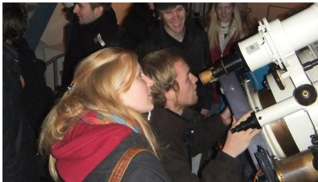
Studierende der HCU bei der Jupiter-Beobachtung am "Großen Refraktor"