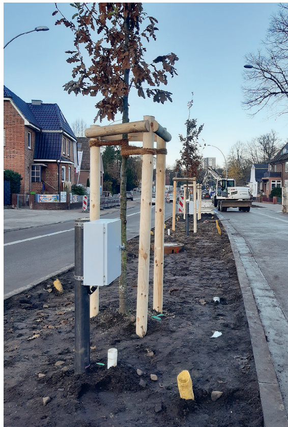
Abb. 4: Einbau der Abdichtung aus Bentonitmatten in Hamburg-Bergedorf (links oben).