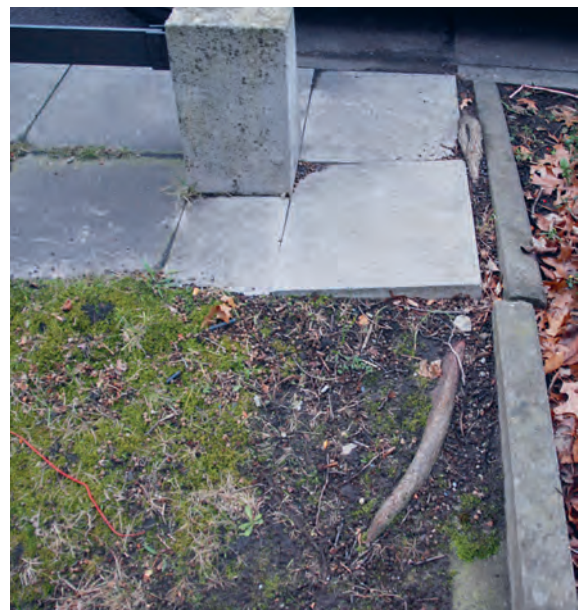
Abb. 12: Auswurzeln aus einer benachbarten Baumscheibe durch lückige Begrenzungen und Hebungen von Kleinstpflaster, Platten etc.