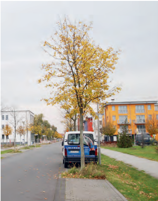
Abb. 6: Vergreiste Baumkronen.