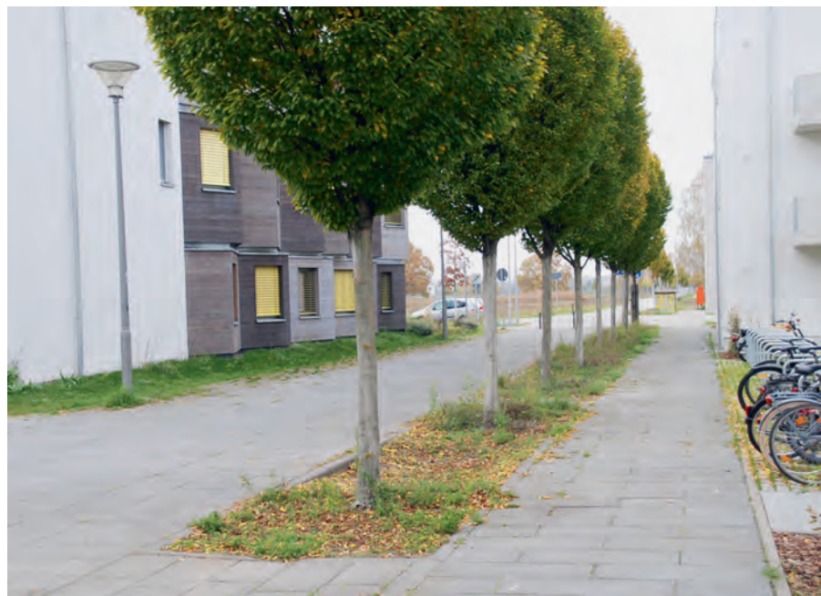
Abb. 5: Harmonische Baumentwicklung einer Baumallee benachbart zu einer Mulde.

Grundsätzlich lässt sich festhalten, dass bei sachgemäßer Planung und Grünpflege eine wechselseitige Verträglichkeit (Baum → Mulde/Mulde → Baum) erreicht werden kann und die oben genannten positiven klimatischen und gestalterischen Aspekte befördert werden können. Ziel der Verwendung von Bäumen in Muldensystemen muss sein, dass sich die Gehölze in der Pflanzphase schnell am Standort etablieren und nachfolgend ein gleichmäßiges Baumwachstum für lange Zeit folgt, ohne dass die Funktion der Mulden beeinträchtigt wird. Dies setzt voraus, dass die Wachstumsansprüche der jeweiligen Baumart erfüllt sind und genügend Wuchsraum – ober- und unterirdisch – für die gesamte Standzeit (!) der Bäume zur Verfügung steht. Die Baum- und Grünpflege muss diesen Prozess unterstützen, damit das gestalterische Grünkonzept insbesondere auch auf Stadtquartiersebene insgesamt erfüllt wird. Die beispielhafte Auswertung der im Muldenbereich gepflanzten Jungbäume ergab, dass sich viele Pflanzungen nach 10- bis 15 jähriger Standzeit harmonisch entwickelt haben (Abb. 5). Das ist unabhängig von der Baumart und der Anordnung der Bäume zur Mulde selbst.