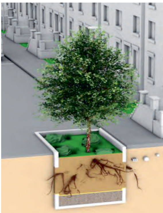
Abb. 1: Theoretisches Konzept einer Baum-Rigole.

Mit der Vorlage des Weißbuches Stadtgrün „Grün in der Stadt – Für eine lebenswerte Zukunft“ empfiehlt der Bund den Kommunen unter anderem die Stärkung des Klimaschutzes in der integrierten Stadtplanung durch funktionales Stadtgrün, um so die Klimafolgen zu mindern (BMUB, 2017). So wird die Notwendigkeit gesehen, zusätzliche Versiegelungen in einer sich verdichtenden Stadt möglichst zu vermeiden und das Regenwassermanagement verstärkt auf Rückhalt und Verdunstung auszurichten. Durch die Förderung der Verdunstung des Regenwassers kann das innerörtliche Klima stabilisiert und das Mikroklima verbessert werden. Da zunehmende Starkregenereignisse auch die Schadenspotenziale von Hochwasser und Überflutung erhöhen und urbane Gewässer durch den Oberflächenabfluss ökologisch stark belastet werden, werden die Regenentwässerungssysteme in immer mehr Städten durch dezentrale und semizentrale Anlagen ergänzt, in denen Niederschlagswasser versickern und verdunsten kann. Diese Strategie ermöglicht, weitere positive Effekte in einem interdisziplinären Ansatz zu verfolgen: