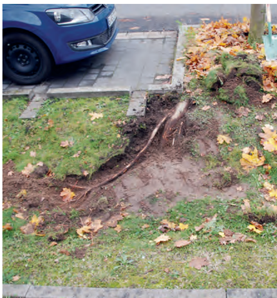
Abb. 11: Charakteristische Wurzelentwicklung bei seitlich angepflanzten Bäumen (Ahorn).

Wachsende Wurzelsysteme benötigen Platz und erobern sich diesen unkontrolliert, sofern sie nicht durch Barrieren daran gehindert werden. Von daher ist es nicht verwunderlich, dass sich bei den meist verwendeten Baumarten (Großbäume) Auswirkungen im Umfeld der Mulden zeigen. So werden unter anderem Beeteinfassungen gehoben, Bürgersteigplatten unterwachsen und gehoben, Asphaltflächen durchdrungen und zerstört (Abb. 14). Aber auch auf Rasenflächen zeigt sich dieser Effekt. Diese Entwicklungen sind nur im Jugendstadium zu korrigieren, betonen aber die