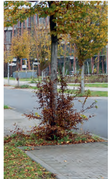
Abb. 8: Erhebliche Stammaustriebe an der Wurzelbasis bei Hainbuche.

Es wurden aber auch Pflanzsituationen angetroffen, wo ein Teil der Bäume in unmittelbarer Nachbarschaft von vitalen Bäumen sich aktuell in einem eher degenerierten, vergreisten Zustand befindet (Abb. 6).