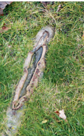
Abb. 10: Oberflächennahe Wurzelentwicklung mit mechanischen Schäden durch Pflegedurchgänge.

grundsätzlich nicht verwendet werden können. Dies ist vielmehr abhängig von den räumlichen Dimensionen (Planung, räumlicher Anspruch der Bäume mit den Standjahren) und den Möglichkeiten, ihre Entwicklung gezielt zu lenken. Positiv muss vermerkt werden, dass bislang in keiner Pflanzung ein Befall mit sog. Schwächeparasiten festgestellt werden konnte. Hierzu zählen unter anderem Splint- und Prachtkäfer, die ansonsten bei Störungen im Wasserhaushalt häufig im urbanen Bereich gestresste Bäume befallen und die Gehölze abtöten.