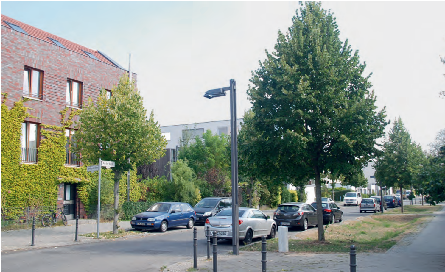
Abb. 9: Deutlicher Zuwachs von Straßenbäumen unter Muldeneinfluss.