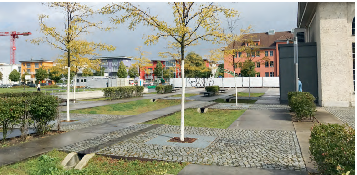
Abb. 2: Schmale Mulde entlang des Straßenkörpers mit seitlicher Bepflanzung.