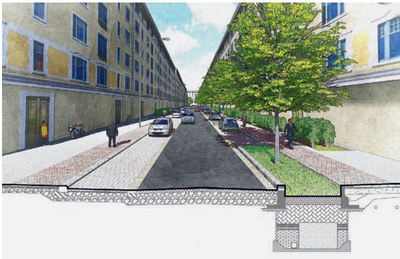
Abb. 7: Baumrigolen mit unterirdischer Abdichtung in der Kasseler Straße in Leipzig.