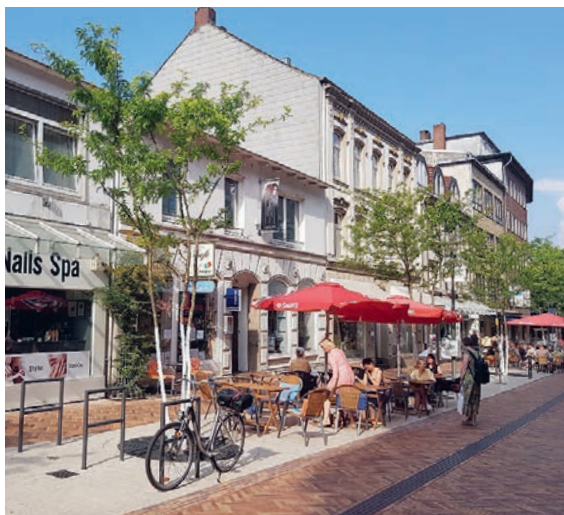
Abb. 3: Baumrigolen in der Fußgängerzone Hölertwiete.