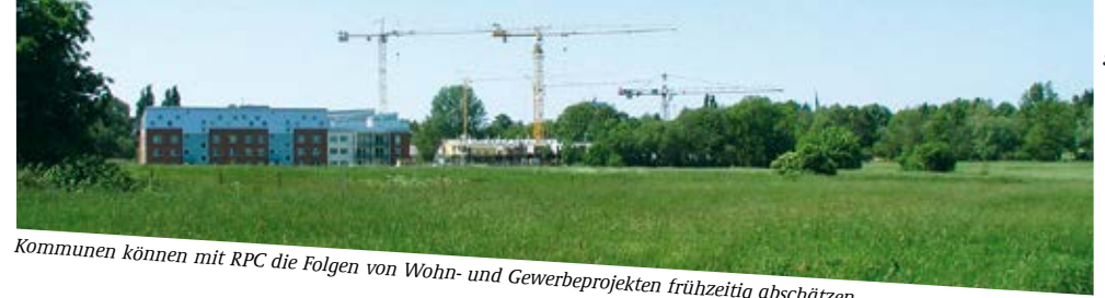
Kommunen können mit RPC die Folgen von Wohn- und Gewerbeprojekten frühzeitig abschätzen