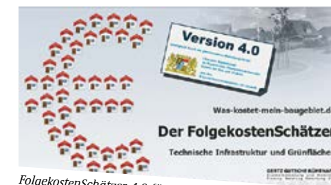
FolgekostenSchätzer 4.0 für bayerische Kommunen

Claus Hensold , Bayerisches Landesamt für Umwelt, claus.hensold@lfu.bayern.de