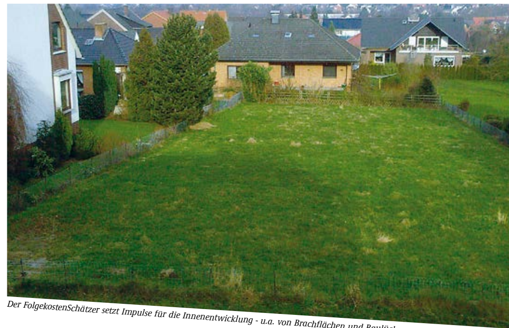
Der FolgekostenSchätzer setzt Impulse für die Innenentwicklung - u.a. von Brachflächen und Baulücken

Jörg Finkeldei, Ministerium für Infrastruktur und Landesplanung des Landes Brandenburg