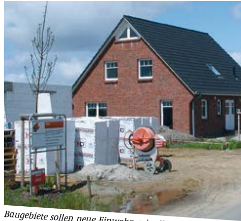
Baugebiete sollen neue Einwohner in die Kommunen „locken“

Das Projekt war Teil der Fördermaßnahme REFINA (Forschung für die Reduzierung der Flächeninanspruchnahme), die vom Bundesministerium für Bildung