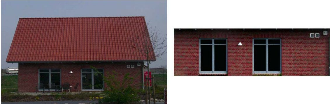
Abb. 2: Perspektivisches Bild (links) und entzerrte Phototextur (rechts)

Um diese Fotos als entzerrte Texturen verwenden zu können, wurden die entsprechenden Bildausschnitte von der Zentralperspektive in eine Parallelprojektion überführt. Zusätzlich wurden störende Elemente in den Fotos wie Vegetation oder Gegenstände durch eine Bearbeitung in Adobe Photoshop entfernt. In Abb. 2 ist eine Fassadenaufnahme und der entsprechende entzerrte Fassadenausschnitt ohne die Vegetation und Stühle abgebildet.