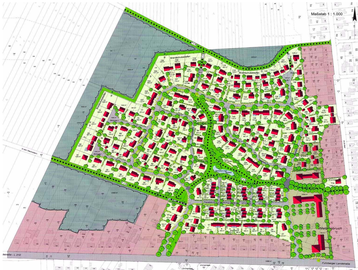
Abb. 1: Bebauungsplan

Das Bebauungsgebiet Wietzenbruch befindet sich im süd-westlichen Teil der Stadt Celle. Es bildet eine Fläche von ca. 20 Hektar, auf denen sich später einmal 152 bebaute Grundstücke verteilen sollen (Abb. 1).