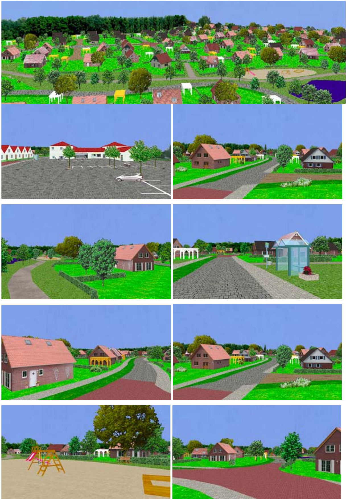
Abb. 5: Perspektivische Ansichten des virtuellen Bebauungsplanes Celle-Wietzenbruch