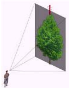
Abb. 3: Vegetationsdarstellung als 2D-Billboard

Die Vegetation ist ein besonders wichtiges Element bei der Visualisierung eines Bebauungsplanes, weil sie einer Szene viel Natürlichkeit verleiht. Da Büsche und Sträucher für eine reine 3D-Darstellung zu komplex sind, benutzt man 2D-Oberflächen (sogenannte Billboards), die sich dem bewegenden Betrachter immer zuwenden (Abb. 3).