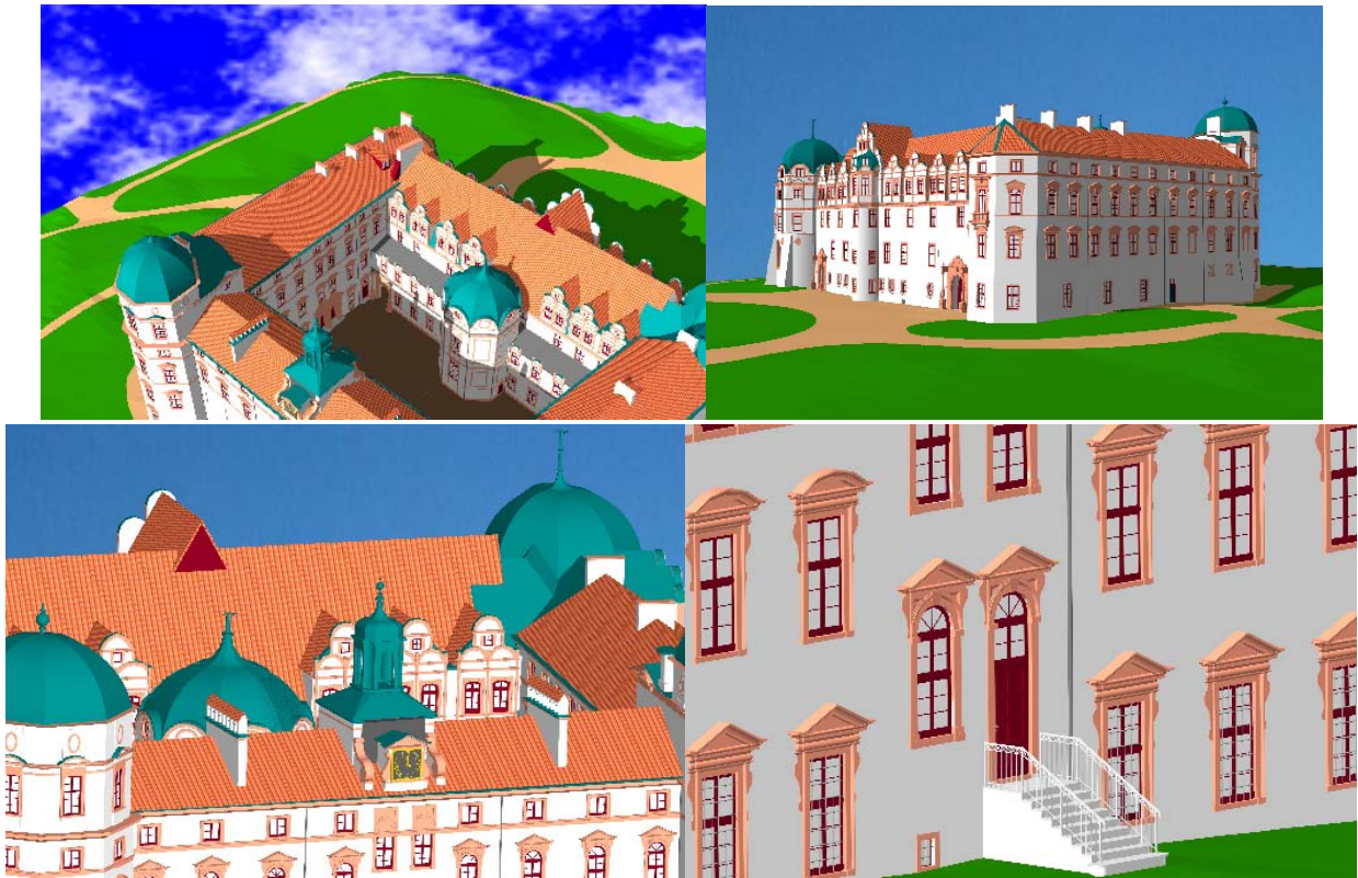
Abb. 6: Diverse perspektivische Ansichten des Celler Schlosses

Bei der Projektbearbeitung ist man schnell an die Leistungskapazität der vorhandenen Rechner gestoßen, da das 3-D Volumenmodell des Celler Schlosses inkl. Topographie als AutoCAD-File ca. 260 MB Speicherplatz benötigte, was die Geschwindigkeit gerade bei der CAD-Bearbeitung erheblich reduzierte. Entsprechend aufgerüstete Computer mit hoher Rechnerleistung von Dual-Prozessoren, mehreren Gigabyte Arbeitsspeicher RAM und einer leistungsfähigen 3D-Graphikkarte sind heute unbedingte Voraussetzung für die CAD-Bearbeitung und Visualisierung von großen Datenvolumen.