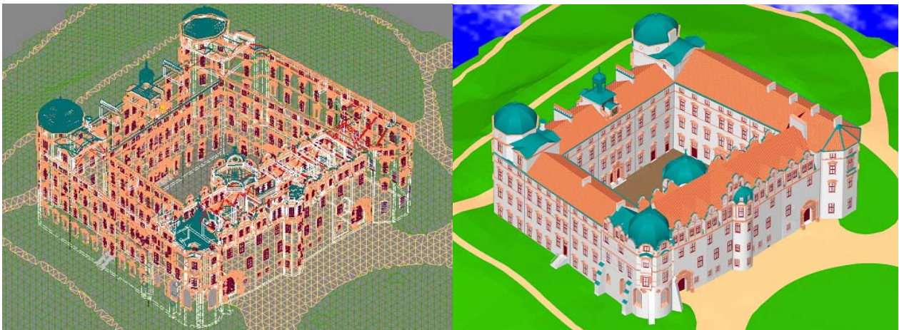
Abb. 5: 3-D-Volumenkörper des Celler Schlosses als Drahtmodell (links) und gerendertes Modell (rechts)

Das Ergebnis der 3D-Konstruktion ist ein Volumenmodell (3D-Volumenkörper, siehe Abb. 5), welches über verschiedene Schnittstellen in AutoCAD in diverse Visualisierungsprogramme wie z.B. 3D Studio VIZ exportiert werden kann. In diesem Projekt wurden allerdings bisher nur die in AutoCAD gegebenen Funktionen für die Herstellung einiger perspektivischer Ansichten benutzt. Dazu wurden u.a. auf die Dachflächen entsprechende Dachziegel-Texturen gelegt. Um die Beleuchtung der Szene realistischer darzustellen, wurden Lichtquellen definiert und Schatten berechnet. Abb. 6 zeigt verschiedene perspektivische Ansichten des Celler Schlosses. Ansprechende Visualisierungen mit Bäumen oder durch Videoanimationen sind zur Zeit in Bearbeitung.